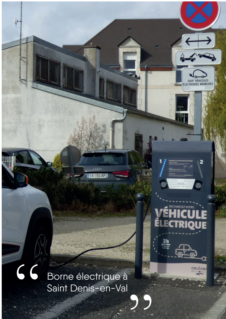
“ Borne électrique à Saint Denis-en-Val ”